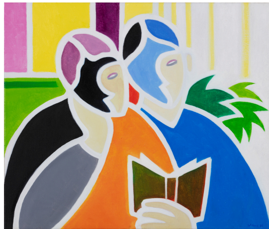
Les liseuses - 1985 Huile sur toile Collection privée