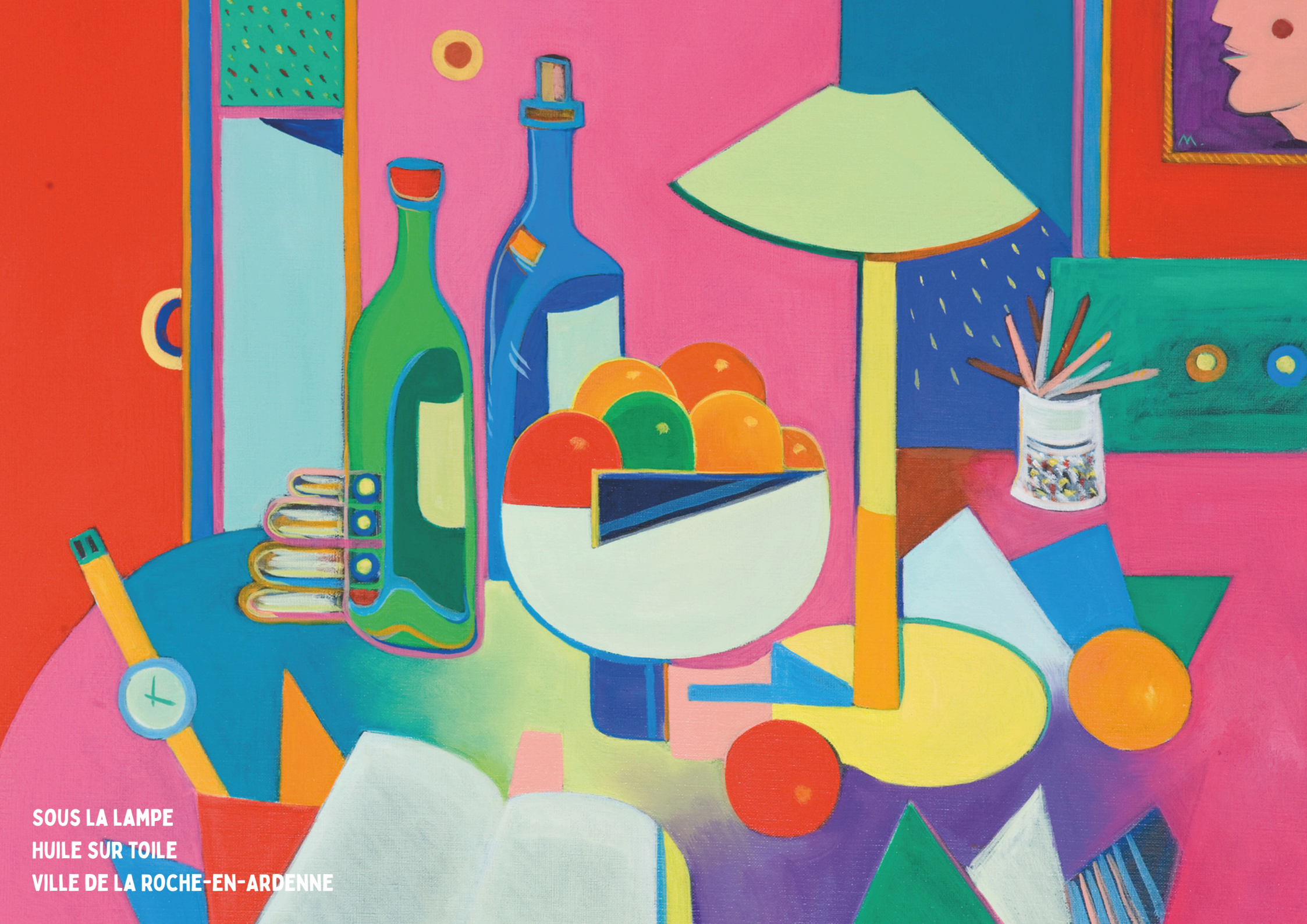
SOUS LA LAMPE HUILE SUR TOILE VILLE DE LA ROCHE-EN-ARDENNE