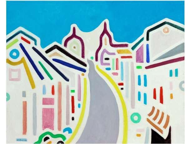
La Grand-Rue de Bastogne - 1984 Huile sur toile Collection privée