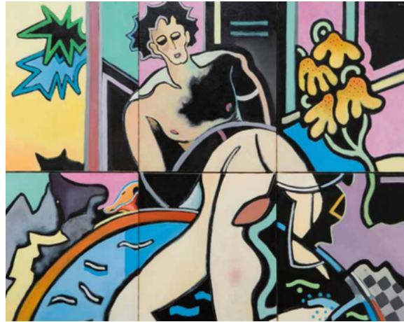
Le bain de l'Ange - 1985 Huile sur toile Collection privée