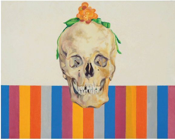
Vanité - 1981 Huile sur toile Collection privée