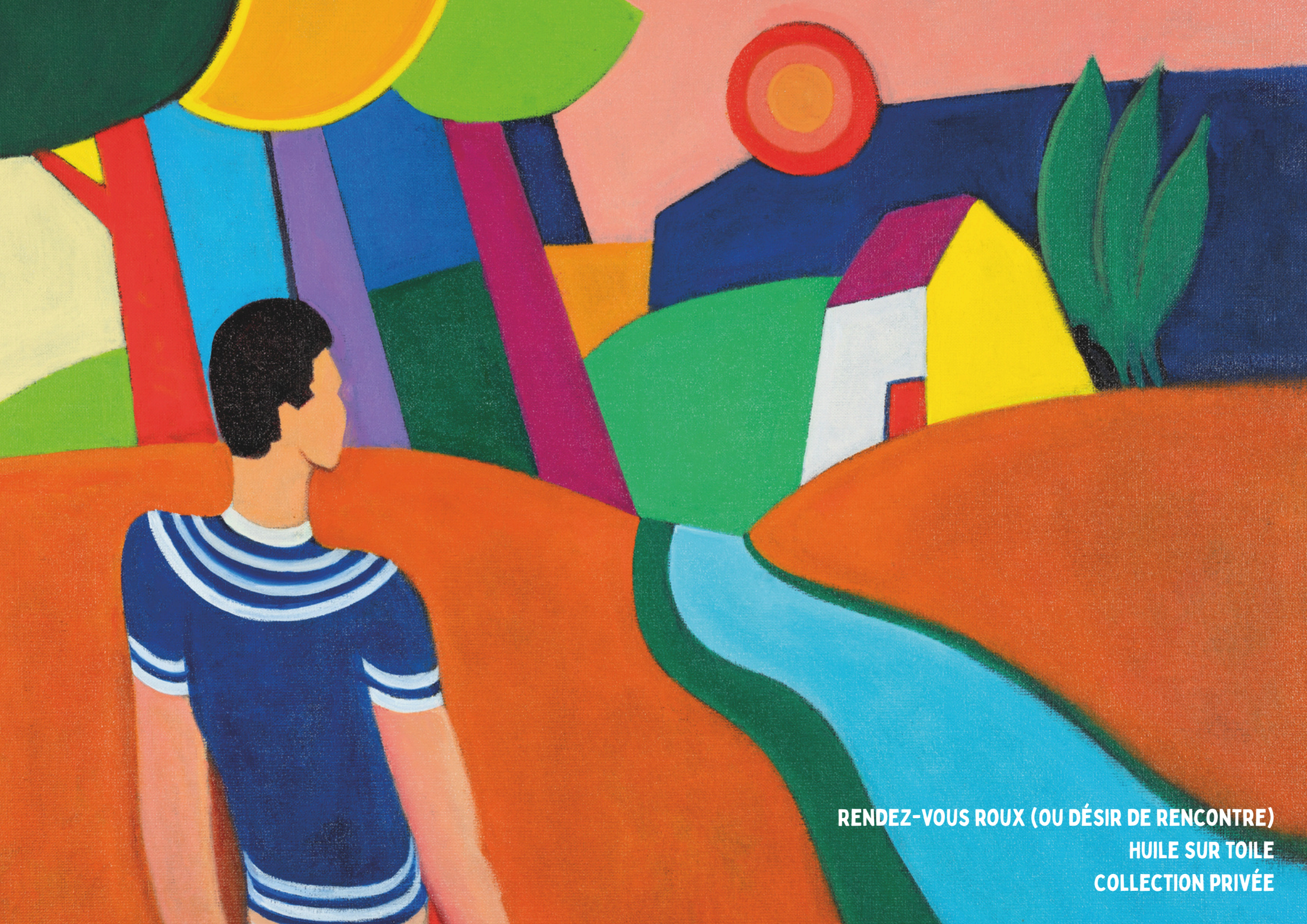
RENDEZ-VOUS ROUX (OU DÉSIR DE RENCONTRE) HUILE SUR TOILE COLLECTION PRIVÉE