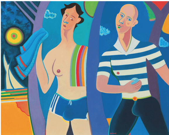
Les joueurs de boules - 1999 Huile sur toile Collection privée