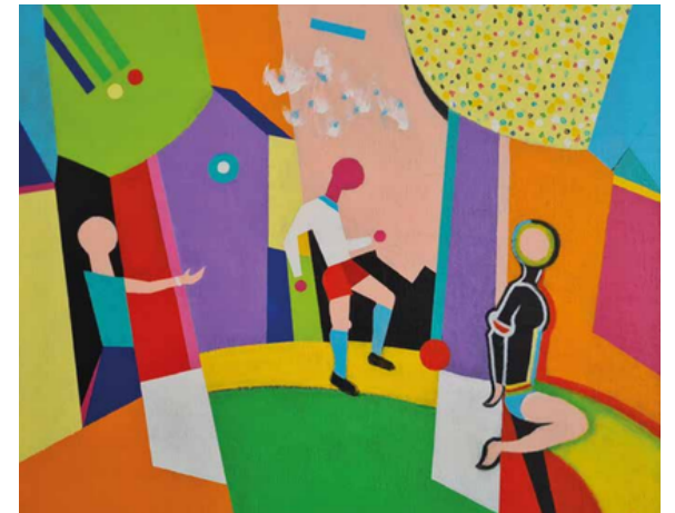
Un si beau Dimanche - 2025 Acrylique sur toile Collection privée